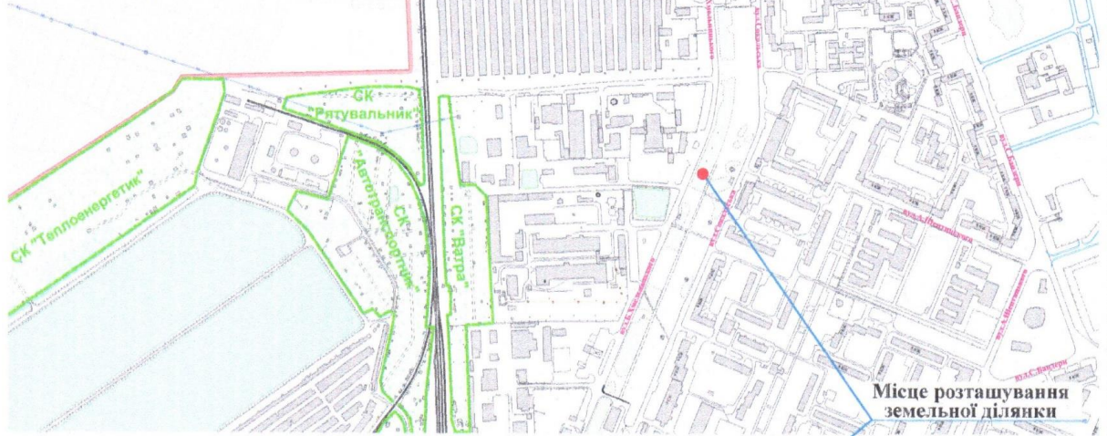
Схема М 1:1000